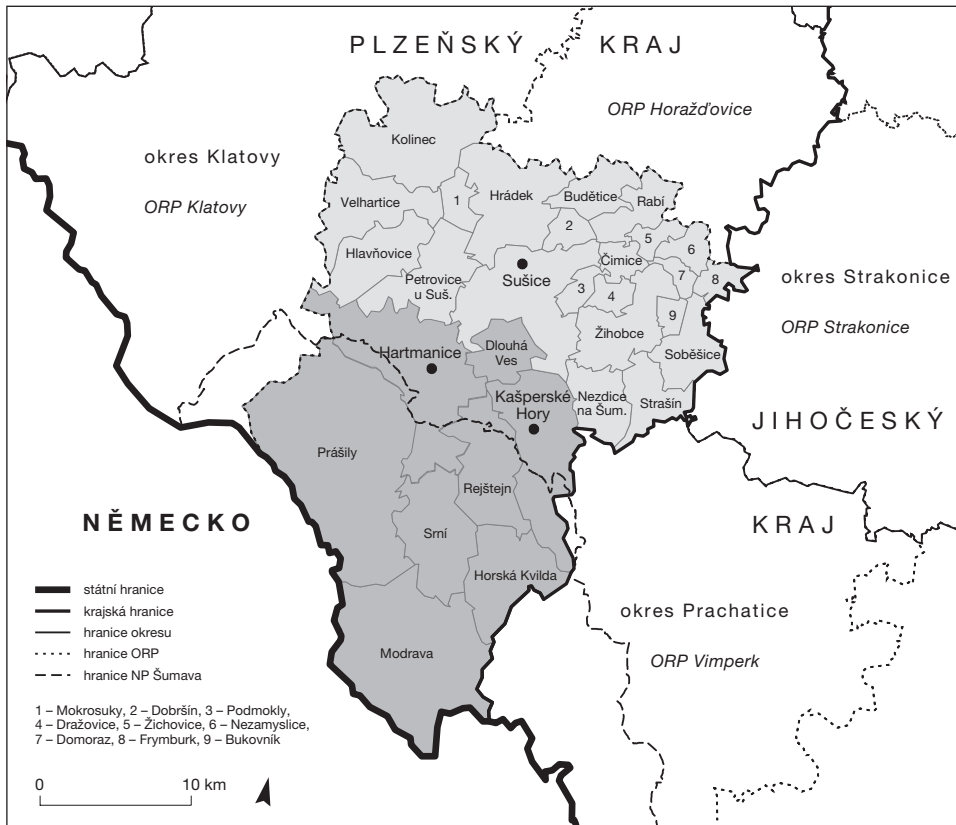
Obr. 1 – Sušicko. Vnitrozemské obce – světle šedě, pohraniční obce – tmavě šedě.

(centrem) Sušicí a hranicí Plzeňského a Jihočeského kraje (Nezdice, Strašín, Žihobce, Frymburk) a (3) podél hranice ORP Sušice a ORP Horažďovice (blíže viz např. Brabec 2002; Musil 1988; Musil, Müller 2008).