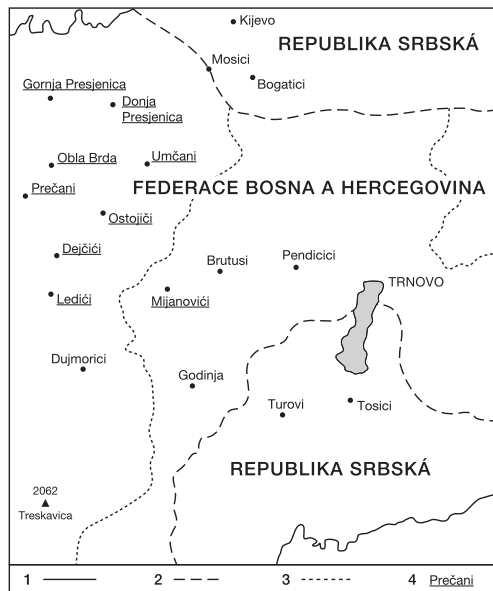
Obr. 2 – Lokality výzkumu Dejčići. Vysvětlivky: 1 – hranice opštiny, 2 – interetnitní hranice, 3 – hranice mjesne zajednice, 4 – lokality výzkumu.

UNHCR uvádí, že se do října roku 2006 vrátilo do federální opštiny Trnovo celkem 225 Srbů, což je úspěšnost 42,8 %. Dle samotného úřadu opštiny Trnovo, který monitoruje na svém prostoru 98 Srbů v roce 2006, je ale úspěšnost minoritní návratnosti Srbů pouze 18,6 %. Pokud se podíváme konkrétně na návratnost do zkoumané mjesne zajednice Dejčići shledáme, že dle úřadu opštiny byla úspěšnost návratnosti Srbů 14 %, dle mého vlastního průzkumu však jde o pouhých 3,33 % (monitoroval jsem zde reálnou návratnost pouze 5 Srbů). Je to také největší zaznamenaný rozpor mezi mými daty (3,33 %) a daty UNHCR (42,8 %). V tabulce 1 a na obrázku 3 jsou zobrazeny rozdíly v odlišném vidění etnické situace v prostoru federální opštiny Trnovo. 19