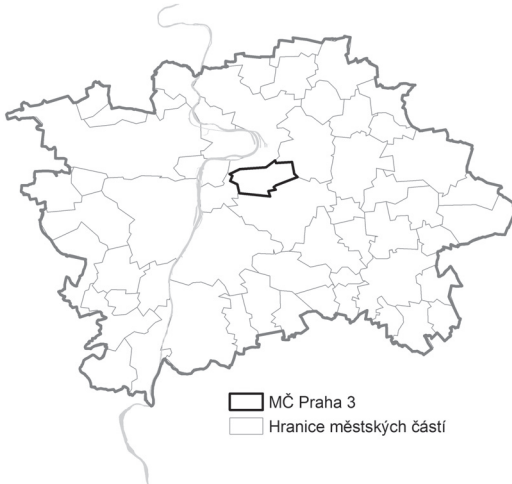
Obr. 1 – Poloha městské části Prahy 3 (Žižkova a Jarova) v rámci Prahy.

průmyslové oblasti, což bylo zapříčiněno nedostatkem vody, nerovným terénem a spekulativní bytovou výstavbou (Hrůza 1989). Zároveň ani jeho rozvoj neprobíhal jednotně, nýbrž se soustředil do více center s různými funkcemi, čemuž odpovídá i dnešní složitá struktura s řadou větších i menších náměstí.