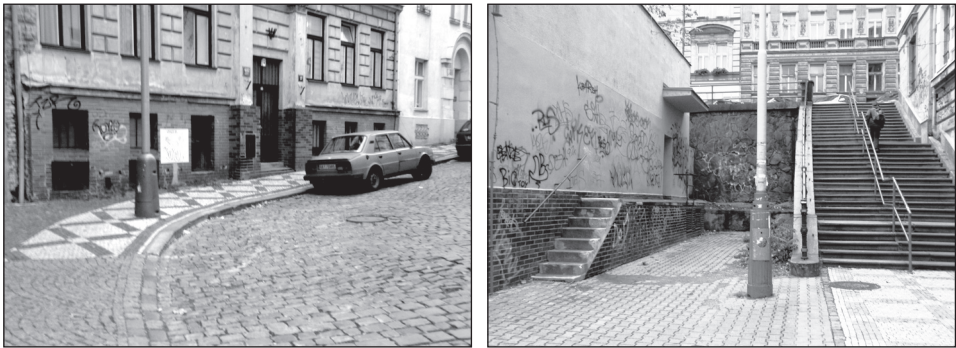
Obr. 4 – Zákoutí Dolního Žižkova.

Mezi další rizikově vnímané lokality zařadili respondenti vrch Vítkov, Židovské pece a Parukářku. Jedná se o poměrně rozlehlé parky s nepřehlednými místy, která byla častým důvodem pocitů strachu a obav. Citelněji však respondenti vnímali přítomnost narkomanů, bezdomovců, exhibicionistů a shlukujících se part mládeže v těchto místech. Strážník sloužící v okrsku Vítkova upozorňuje zejména na sezónní nárůst rizikivosti, který souvisí se zvýšenou přítomností narkomanů v letních měsících. V případě Židovských pecí uvádí místní strážník pouze přestupky proti veřejnému pořádku (poškození hřiště), ač respondenti vidí za svými obavami širší škálu důvodů (např. narkomany, party mládeže). Karlínský tunel považovali někteří respondenti za nebezpečný kvůli nepřehlednosti a opuštěnosti, přítomnosti Romů, „podivných individuí“, narkomanů