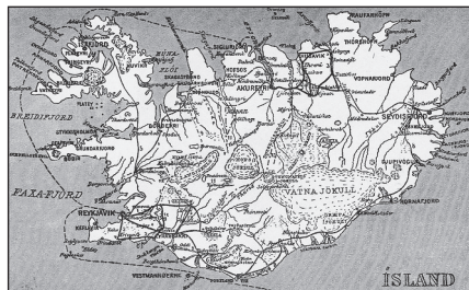
Obr. 1 – Vulkanologické studie na Islandu.

1992–1995. 4x ročně. Excerptováno od roku: 1992–1995 (101 záznamů).