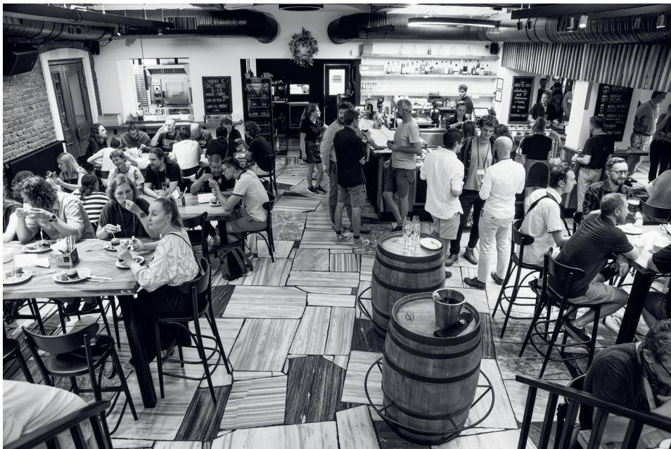
Společenský večer v restauraci Tyršovka.