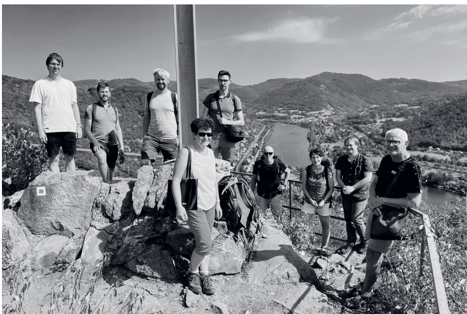
Účastníci závěrečné exkurze.