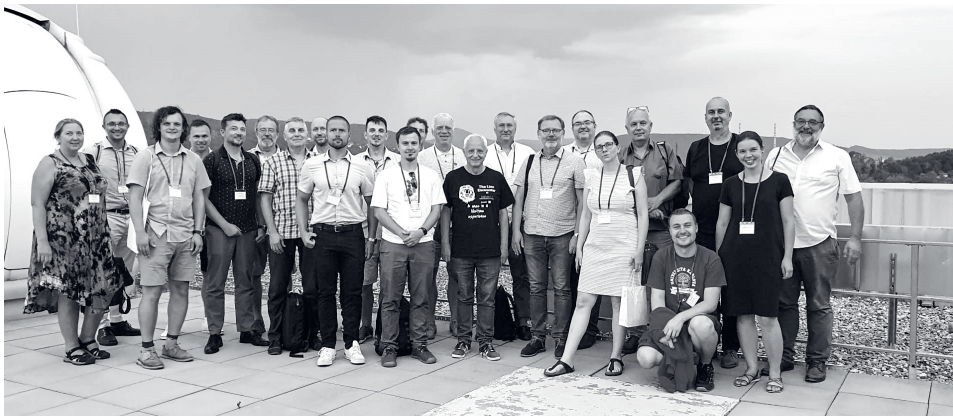
Hlavní výbor ČGS po svém jednání 3. 9. 2024 v Ústí nad Labem.

setkání EUGEO. Tlumočil mj. pozvání na příští kongres EUGEO, který se bude konat v září 2025 ve Vídni, a výzvu k účasti na dalším ročníku celoevropského projektu Geo-Night .