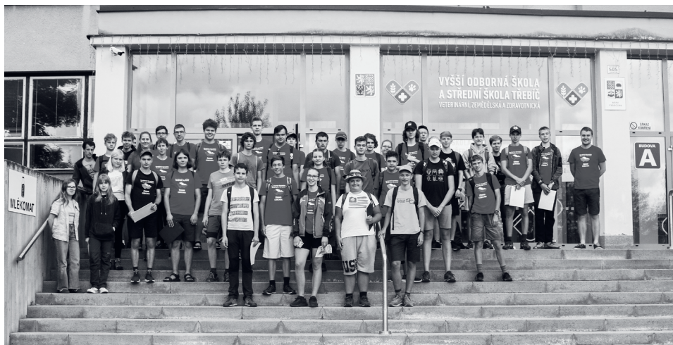
Účastníci letní školy 2024 v Třebíči.

geografická společnost apod.) a také s mezinárodním prostředím ( International Geography olympiad , European geography olympiad apod.). Věříme, že na nový název si soutěžící i vyučující rychle zvyknou a ocení tento posun.